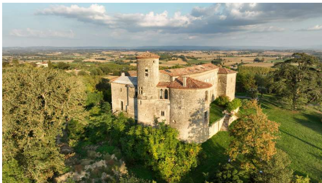
Château du Cuq

Pour en savoir plus : https://www.fondation-patrimoine.org/les-projets/chateau-feodal-de-cug-a-cug/100146