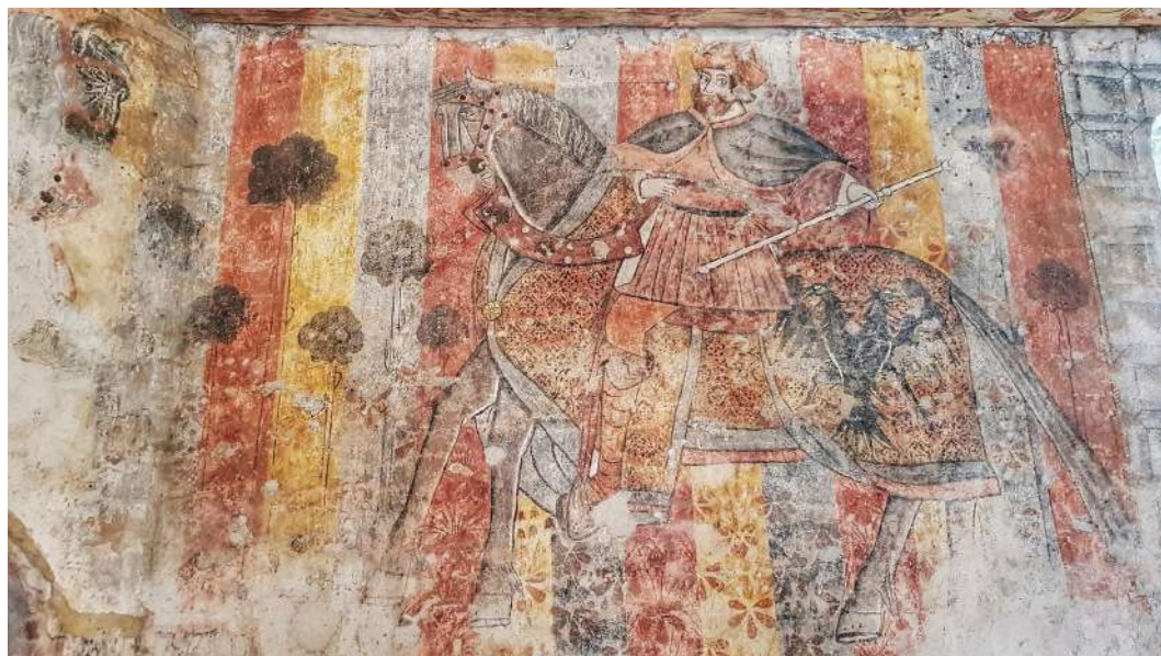
Fresque du château de Bioule © Fondation du patrimoine

Pour en savoir plus : https://www.fondation-patrimoine.org/les-projets/chateau-de-bioule/103673