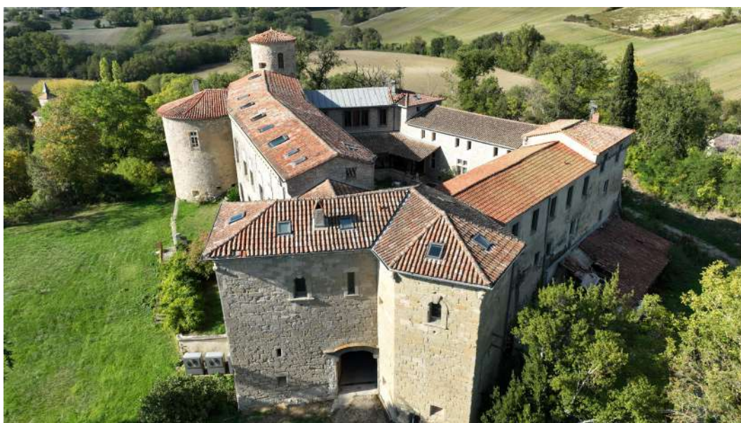
Château de Cuq

Protection au titre des monuments historiques : non protégé