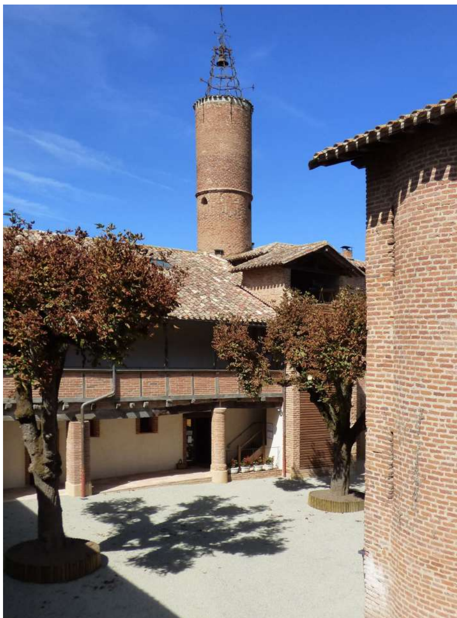
Château de Bioule