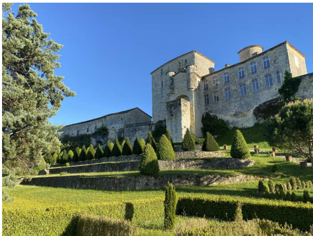
Château de Courrensan

Protection au titre des monuments historiques : inscrit