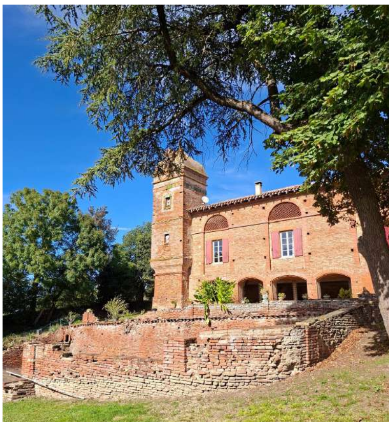
Château de Montlaur

Protection au titre des monuments historiques : inscrit