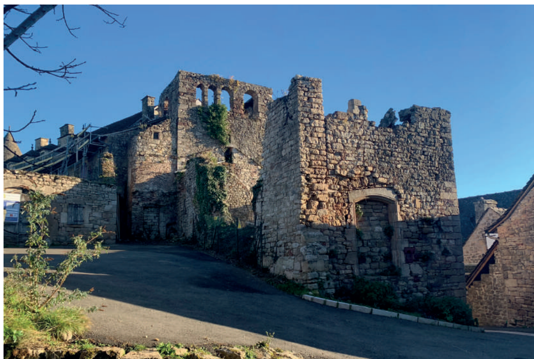
Eglise du château de Panat

Pour en savoir plus : https://www.fondation-patrimoine.org/les-projets/domaine-de-panat-a-clairveaux-daveyron/103735