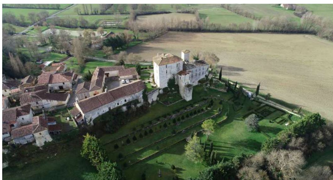
Château de Courrensan

Pour en savoir plus : https://www.fondation-patrimoine.org/les-projets/chateau-de-courrensan/101986