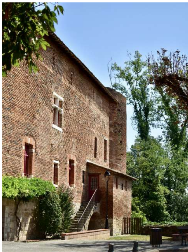
Château de Bioule

Protection au titre des monuments historiques : classé