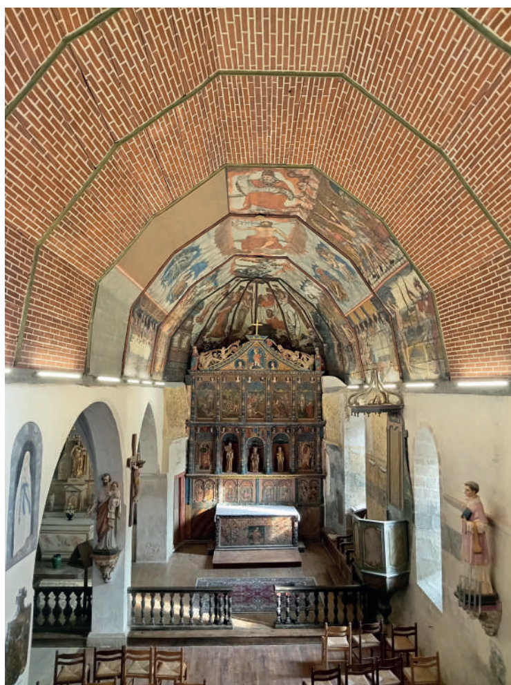
Eglise de Jézeau

Pour en savoir plus : https://www.fondation-patrimoine.org/les-projets/eglise-notre-dame-saint-laurent-a-jezeau/103726