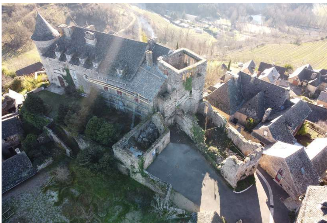
Eglise du château de Panat

Protection au titre des monuments historiques : inscrit