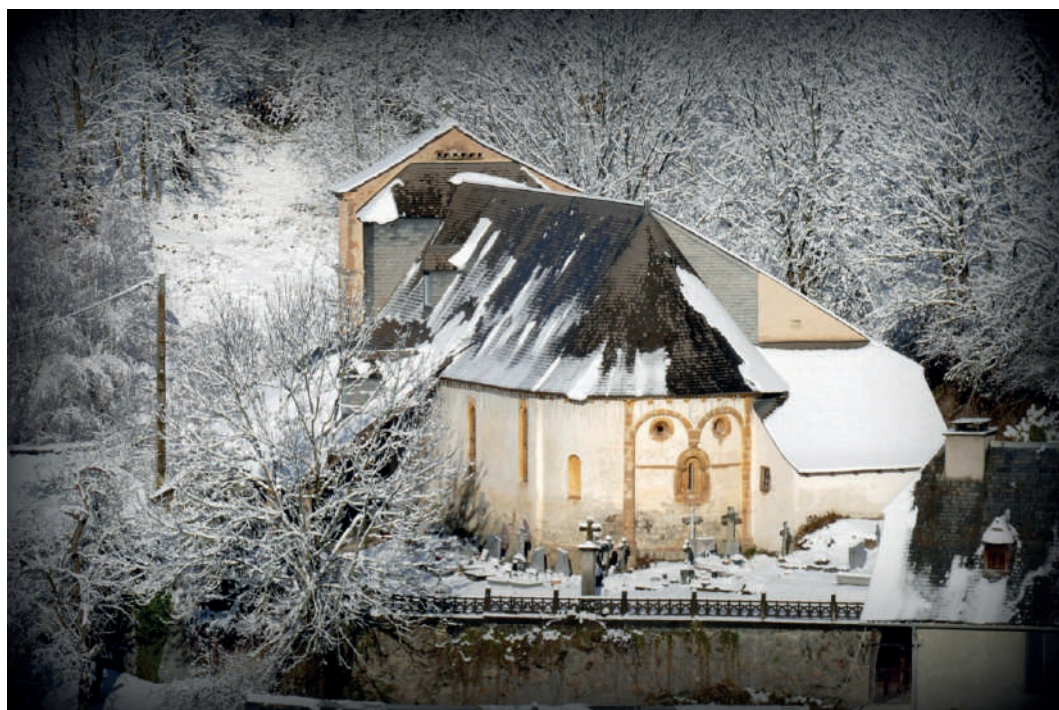
Eglise de Jézeau

Protection au titre des monuments historiques : classée