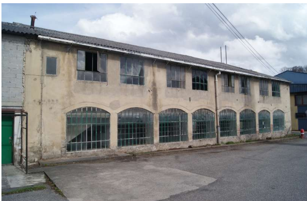
Ancienne usine Dumons

Protection au titre des monuments historiques : non protégé