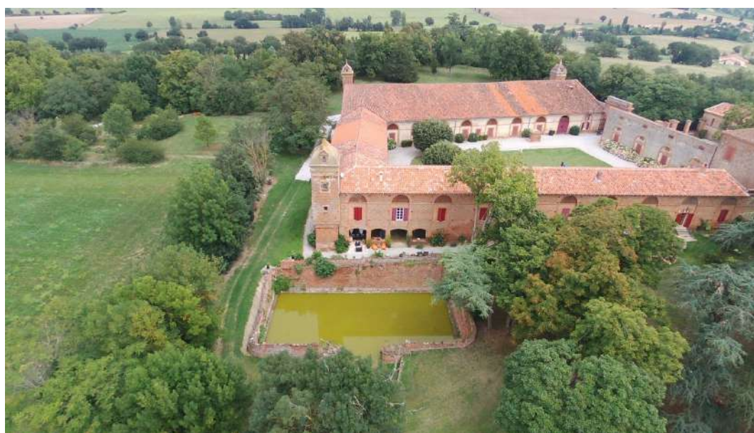
Château de Montlaur

Pour en savoir plus : https://www.fondation-patrimoine.org/les-projets/chateau-de-montlaur-de-batz/101978