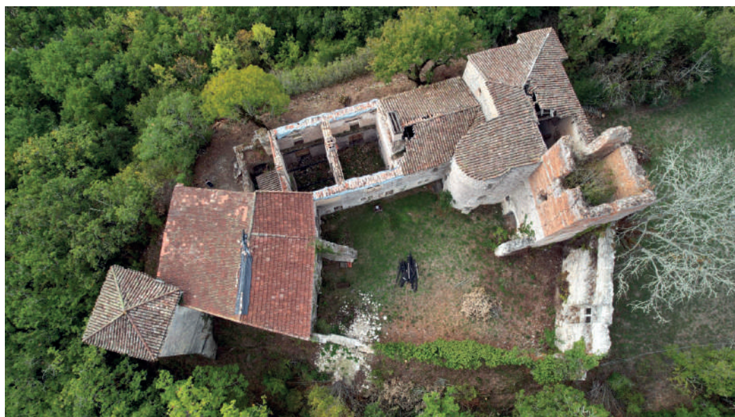
Château de Marcillac

Protection au titre des monuments historiques : inscrit