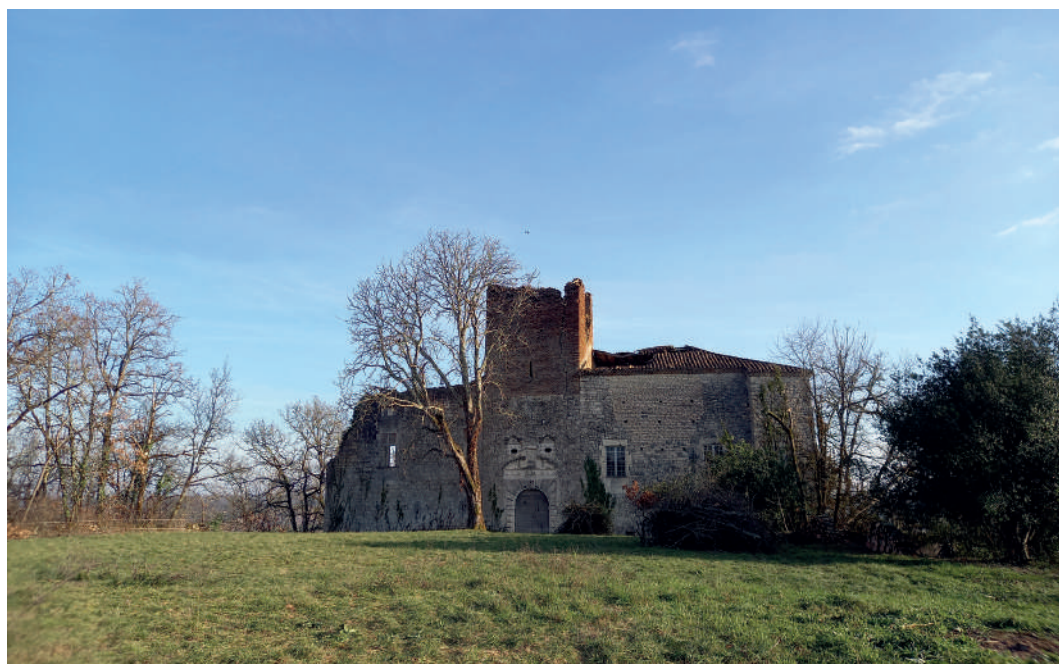
Château de Marcillac

Pour en savoir plus : https://www.fondation-patrimoine.org/les-projets/domaine-de-marcillac-dans-le-lot/90786