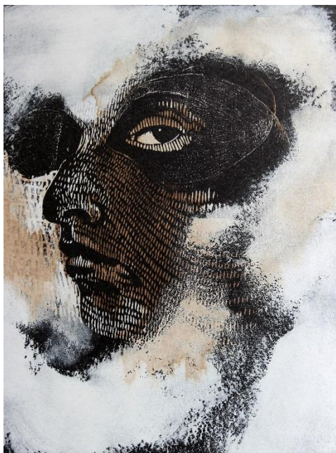
© Visage, Série Humaine , Iris Miranda

Visuel disponible pour la presse : merci de préciser les crédits